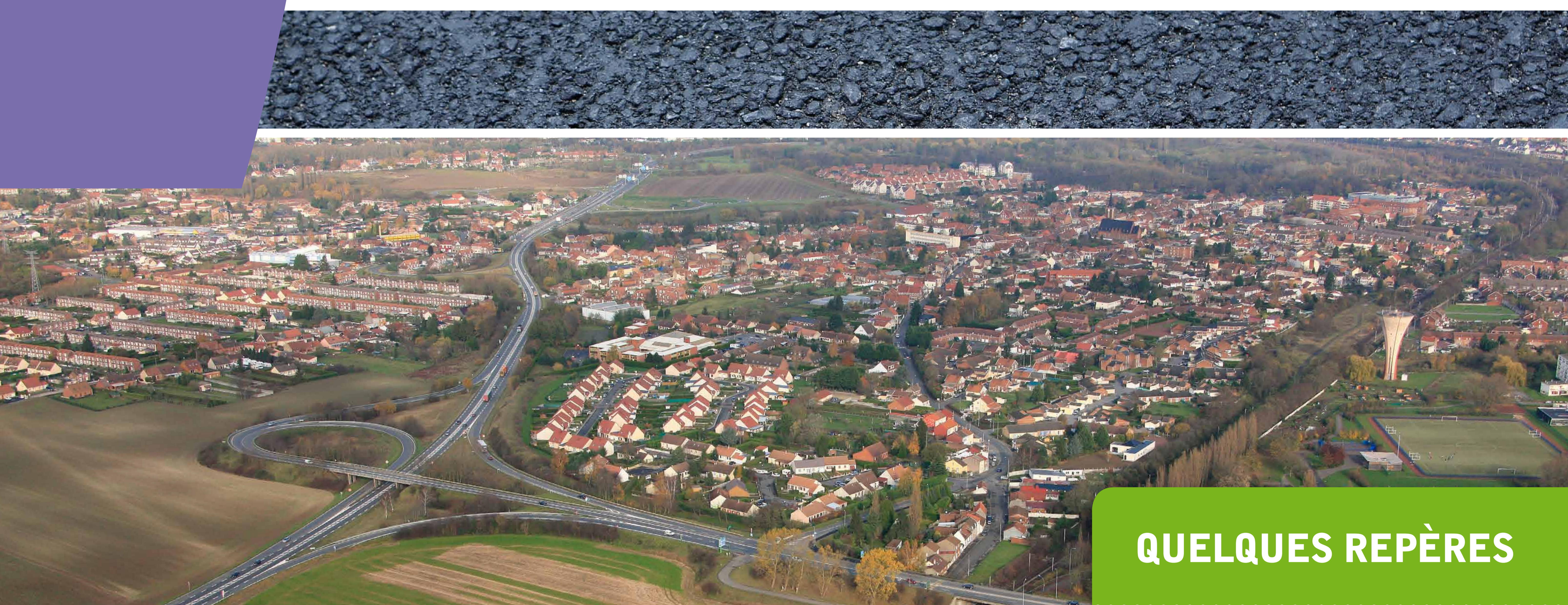
LA RN17 À AVION

Ce projet s'inscrit dans le cadre d'un programme général d'aménagement homogène et sécurisé de l'itinéraire Arras-Lens, qui recevra le statut de route express (route dont les accès directs des riverains sont interdits et l'accès des véhicules lents ou susceptibles de mettre en cause la sécurité des usagers est restreint).