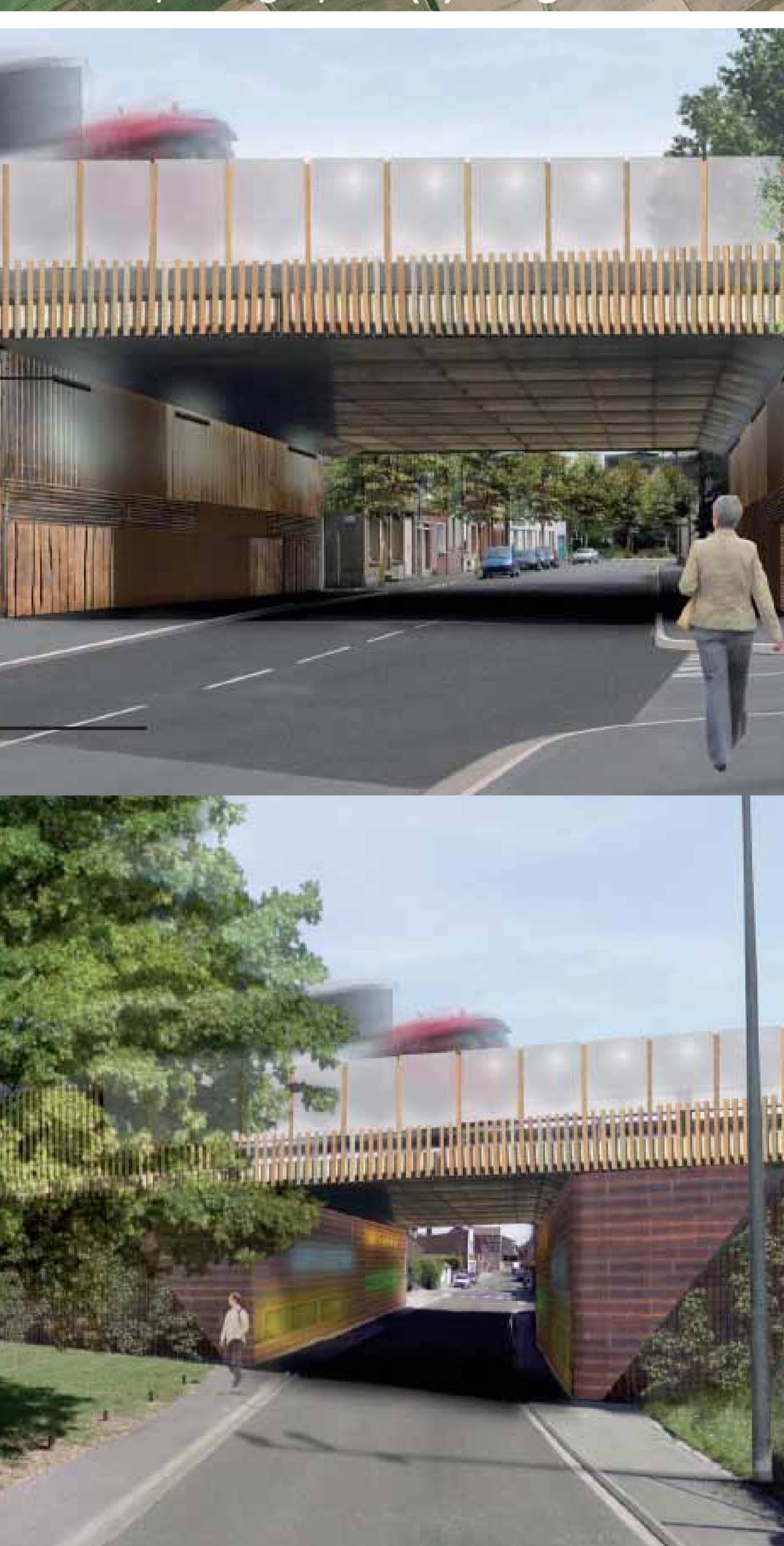
PROPOSITIONS DE TRAITEMENT DES PONTS À DOUBLER