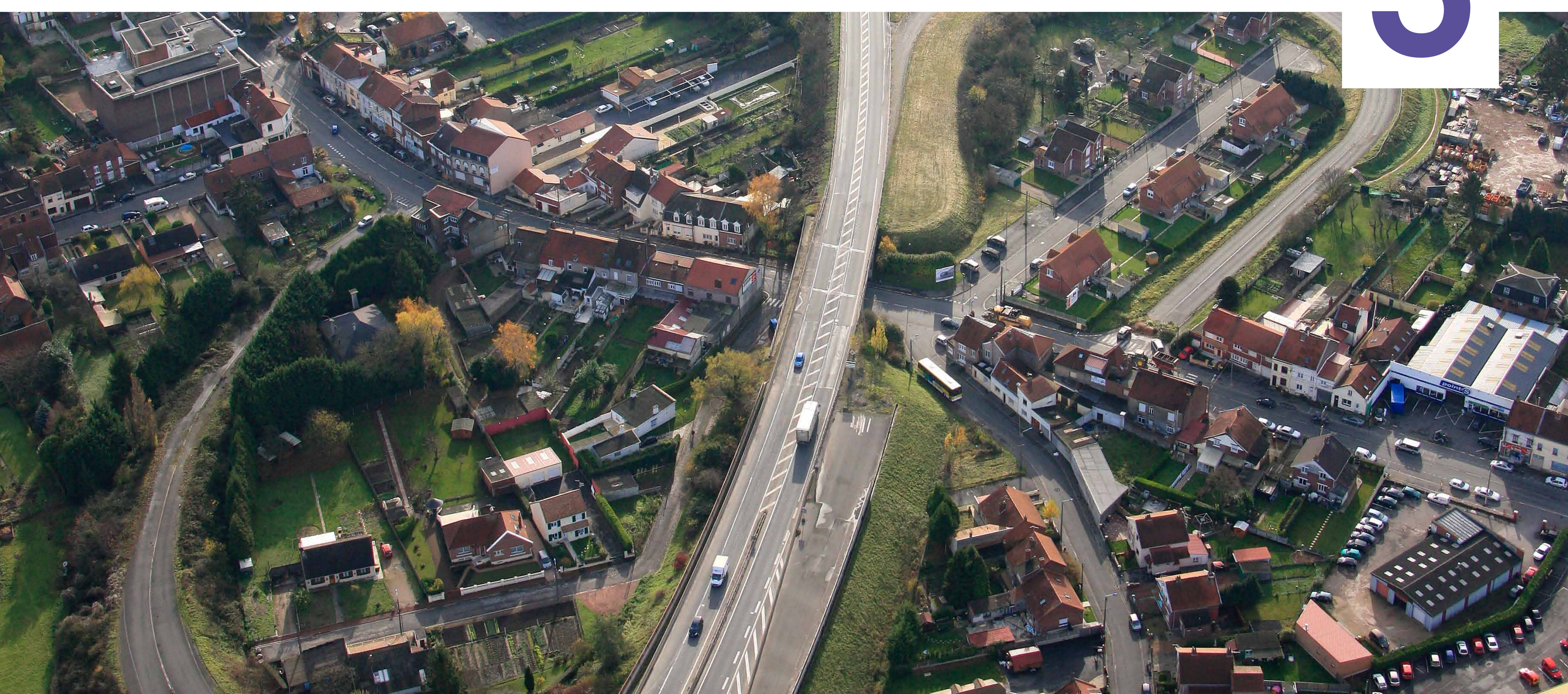
LA RN17 À AVION (ANCIEN ÉCHANGEUR AVION-CENTRE)